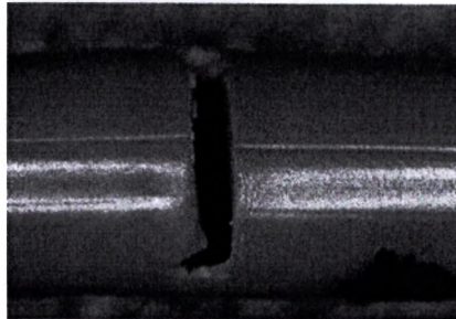
Рисунок 1. Пример поперечной/кольцевой трещины в трубке катетера

На основании обратной связи от клиентов и постоянных исследований компания BD дополнительно усовершенствовала спецификацию, связанную с индексом текучести расплава (MFI), в целях обеспечения эксплуатационной пригодности изделий, что привело к расширению области применения уведомления FSN (см. приложение 1, приложение 2-С), таким образом, компания разъясняет инструкции для клиентов.